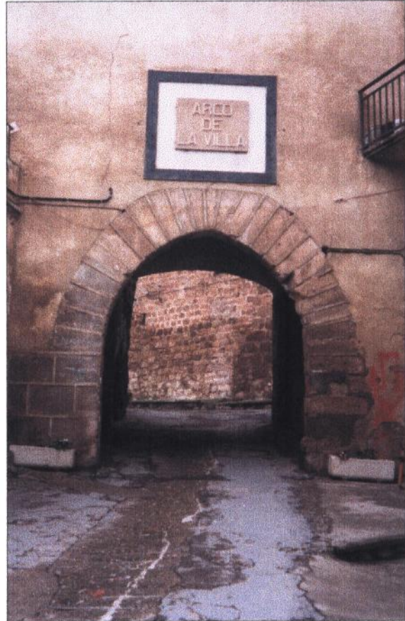
Arco de acceso