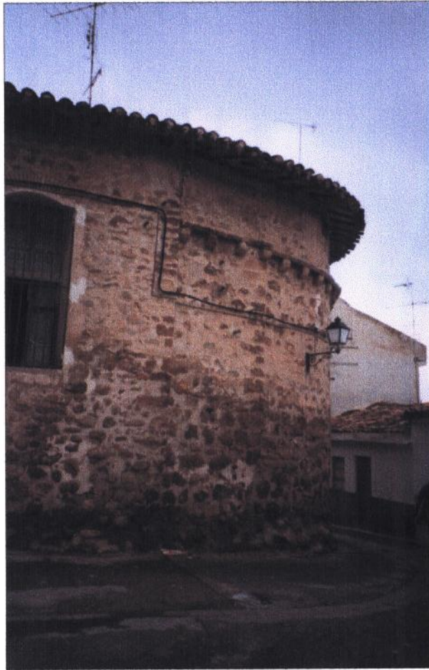
Ermita del Cristo