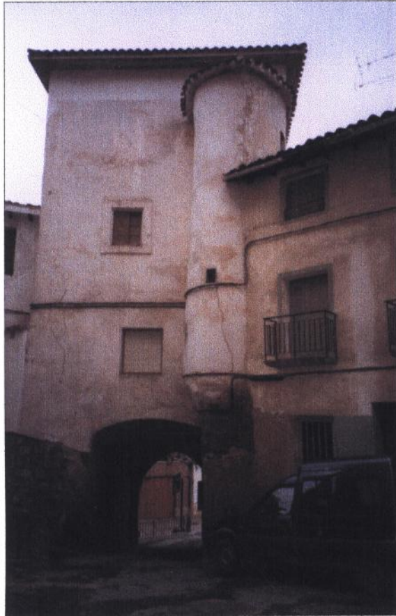
Torreón en puerta de entrada