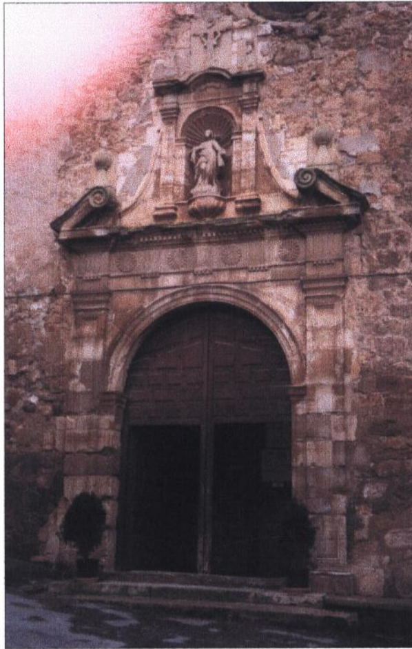
Iglesia Parroquial Nuestra Señora de la Asunción