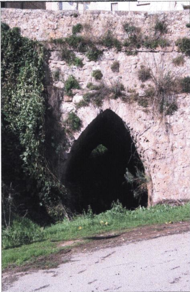
Puente ojival sobre el barranco en la N-111